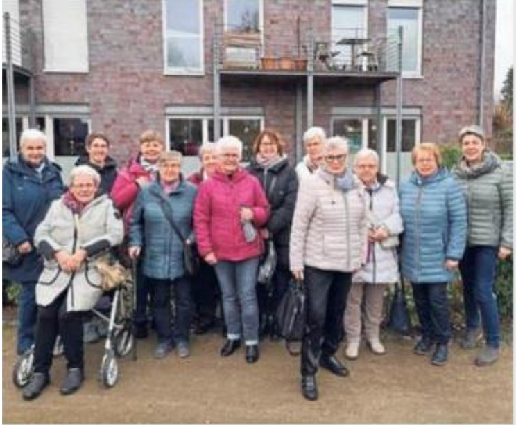
Frauen der kfd Bad Westernkotten sind nach Liesborn gefahren und beteten dort den Kreuzweg.