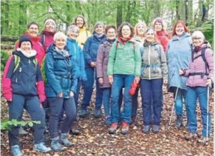
Die „Wanderung und Spiritualität“ führte die kfd Bad Westernkotten auf den Hollenpfad in Bödefeld.