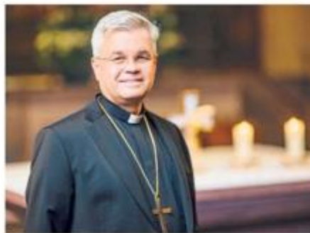
Dr. Udo Markus Bentz wird am 10. März im Hohen Dom zu Paderborn in sein Amt als neuer Erzbischof eingeführt.

Möglichst viele Menschen sollen am Gottesdienst teilhaben können: Im Dom steht neben den Plätzen für geladene Ehrengäste eine begrenzte Zahl an weiteren Plätzen zur Verfügung. Gläubige können zudem in der Paderborner Kaiserpfalz und in der neben dem Dom gelegenen Gaukirche per Direktübertragung beim Gottesdienst dabei sein. Der WDR und der HR übertragen in ihren dritten TV-Programmen live den Gottesdienst aus dem Dom. Nicht