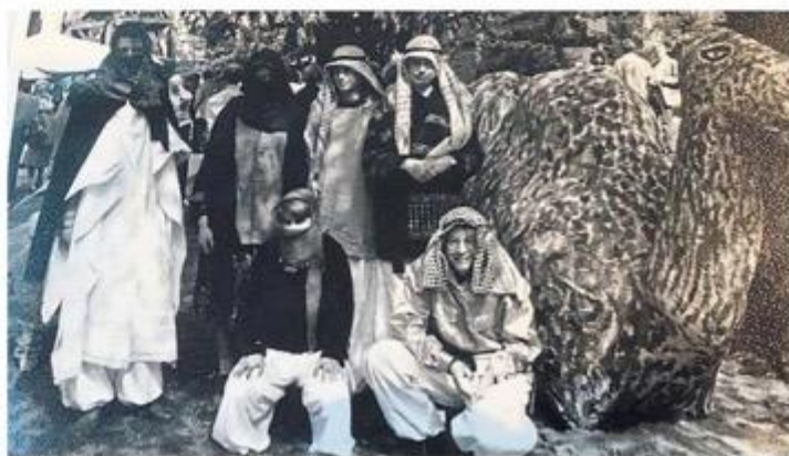
Die Akteure waren auch schonmal als Scheichs unterwegs.