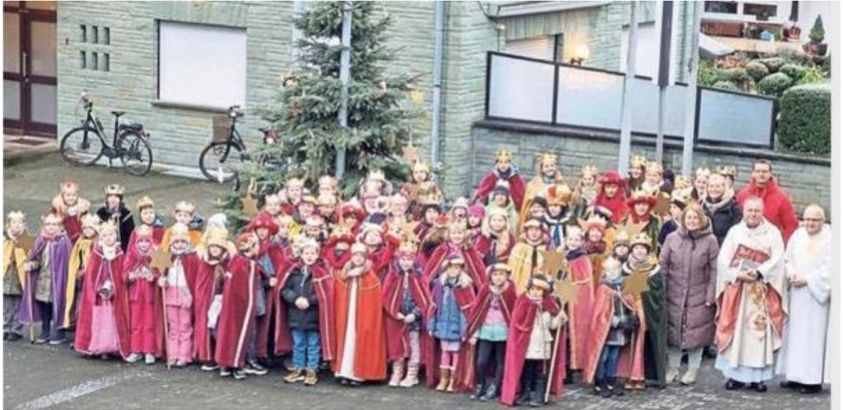
Insgesamt 71 Sternsinger machten sich in der Gemeinde Bad Westernkotten und zehn in Eikeloh auf den Weg. So konnten die Kinder in allen Straßen den Segen zu den Menschen bringen.

welchem Bilder und Gedanken auf die Wand projiziert werden. Andere Teile, wie das Eingabegerät und weitere Technik in den Räumen der Sakristei wurden mit viel ehrenamtlichen Engagement fertiggestellt. Nun fallen für die endgültige Fertigstellung der Technik weitere 2.200 € Aufwendungen an, die noch nicht finanziert sind. Die Kirchengemeinde bittet um Spenden für dieses Projekt. Die Kontoverbindungen lauten Volksbank Anröchte DE85 4166 1206 4501 1344 00 oder Sparkasse Hellweg-Lippe DE 55 4165 0001 0004 6421 53. Auf Wunsch können Spendenquittungen ausgestellt werden.