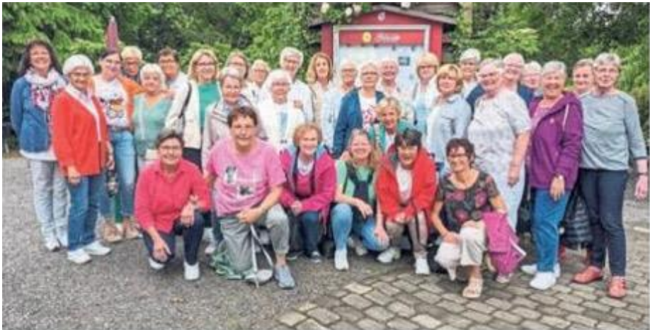
Die Frauen der Gruppe „Vier Jahreszeiten“ der kfd Bad Westernkotten besuchten den Rosengarten Heidrich am Gutshof Schloss Bruchhausen. Anschließend schmeckte den Frauen die hauseigene Gewittertorte.