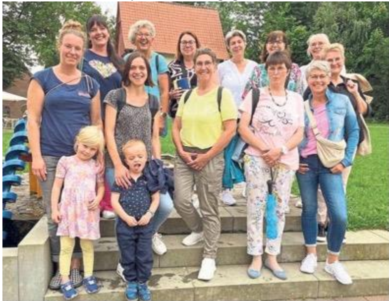
Die kfd Bad Westernkotten besuchte bei ihrem Halbtagesausflug die Westfälischen Salzwelten in Bad Sassendorf.