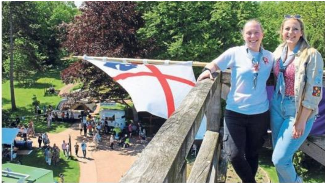
Hoch über der Salinenkirmes weht vom Gradierwerk aus die Flagge der Pfadfinder.