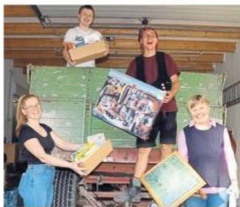
Jede Menge Trödel haben die Pfadfinder gesammelt.

Die Salinenkirmes findet am Sonntag, 12. Mai, im Kurpark in Bad Westernkotten statt. Los geht's um 9.30 Uhr mit einem Gottesdienst. Im Anschluss öffnen die Spiel- und Verpflegungsstände sowie der Trödelmarkt.