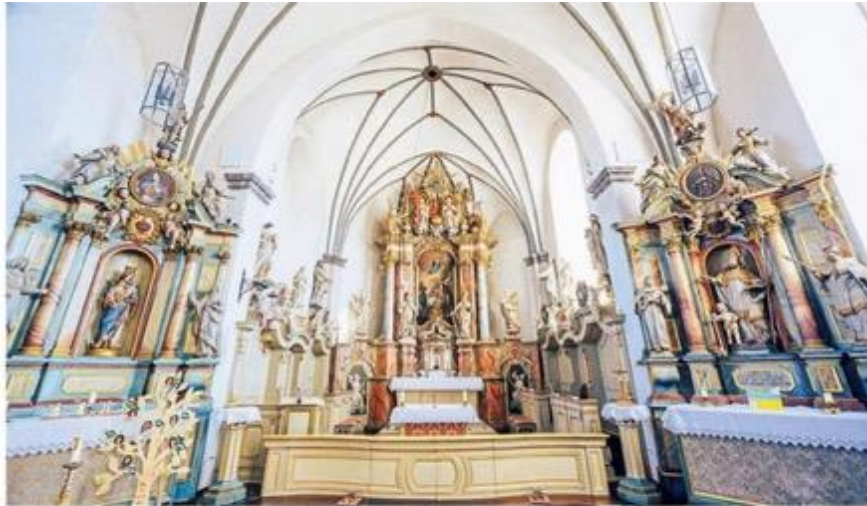
Die Kirche St. Clemens in Kallenhardt ist eine denkmalgeschützte Kirche. Doch im Zuge der Immobilienstrategie schützt Denkmalchutz nicht vor einer Trennung. Das hat sich jüngst in Wanne-Eickel gezeigt, wo ein denkmalgeschütztes Gotteshaus vom Erzbistum aufgegeben wurde.