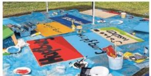
Von der Hüpfburg bis zur Lagerbar: Die Pfadfinder malten neue Schilder für die Salinenkirmes.