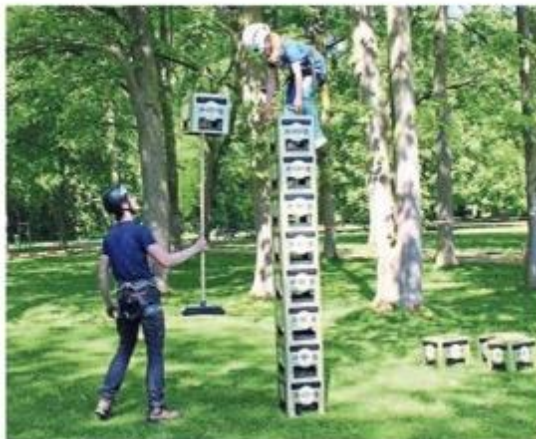
Bier ist nicht nur zum Trinken da: Die Kisten kann man auch prima zu einem Turm stapeln.

Der Kirmestag begann zunächst mit einem Gottesdienst, der ebenfalls draußen im Park stattfand. In diesem Jahr stand er unter dem Mot-