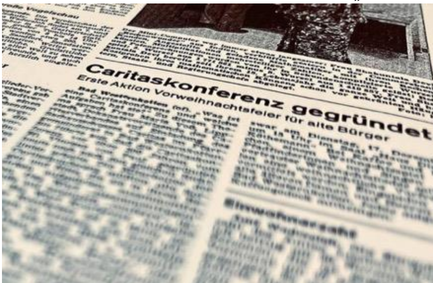
Anfang Dezember 1974 berichtete unsere Zeitung über die Geburtsstunde des gemeinnützigen Vereins im Kurort.