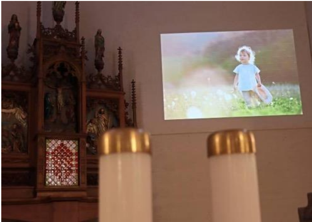
Ein Beamer projiziert die kurzen Videos auf die Wand hinter dem Altar.