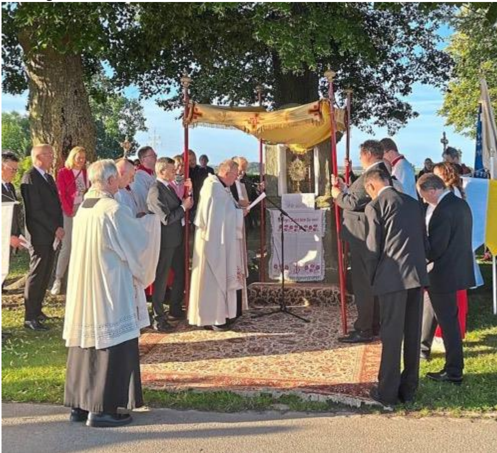
Erste Station der Prozessionsteilnehmer war an der Josefslinde.