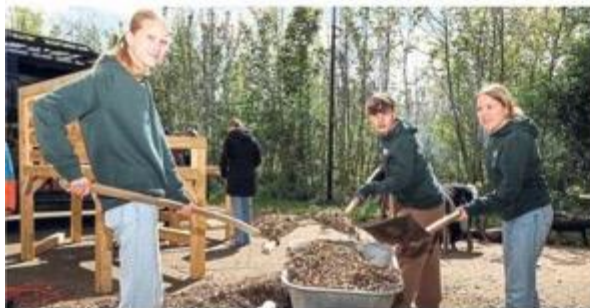
Diese drei Pfadfinder verteilen Hackschnitzel als Untergrund für den neuen Standort der XXL-Bank.