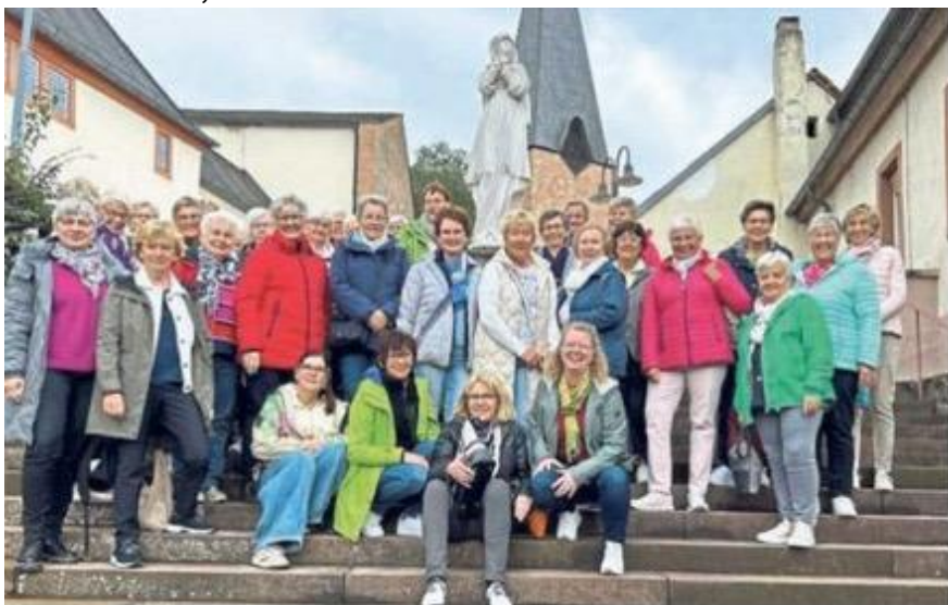
Ihr 40-jähriges Bestehen feierten die Frauen der kfd Gruppe „vier Jahreszeiten“ mit einer Reise zum Wirtshaus im Spessart.