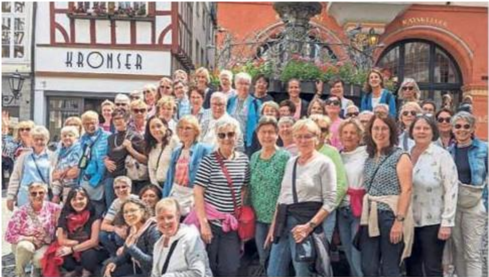
Die Frauen der kfd Bad Westernkotten verbrachten sonnige Tage an der Mosel. Ein Besuch in Trier und Luxemburg durfte nicht fehlen. In den Weinbergen gab es manch gutes Tröpfchen.