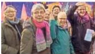
Die Caritas-Gruppe spendete fürs Weihnachtswunder.

Bad Westernkotten – Auch Mitglieder der Caritasgruppe Bad Westernkotten haben jetzt für das WDR2-Weihnachtswunder gespendet. Den Umschlag mit 350 Euro übergaben sie persönlich in Paderborn. Der Erlös stammt aus der Sammlung nach dem Singen am ersten Advent.