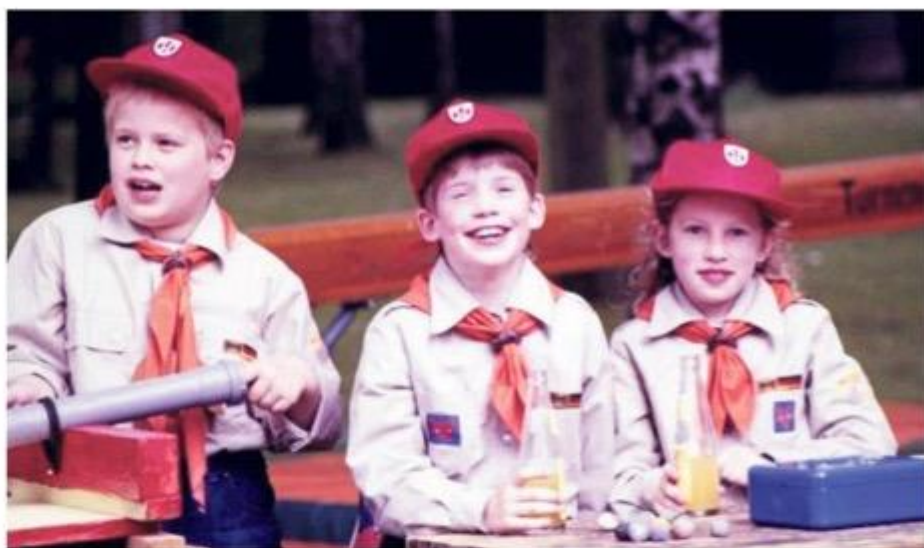
Gut gelaunt mit Limo in der Hand: Damals wie heute sind die Pfadfinder Hauptakteure der Salinenkirmes.