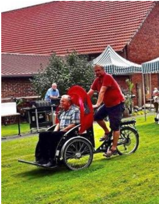
Die Caritas-Konferenz vermittelt auch Rikscha-Fahrten. „Caritaskonferenz gegründet“