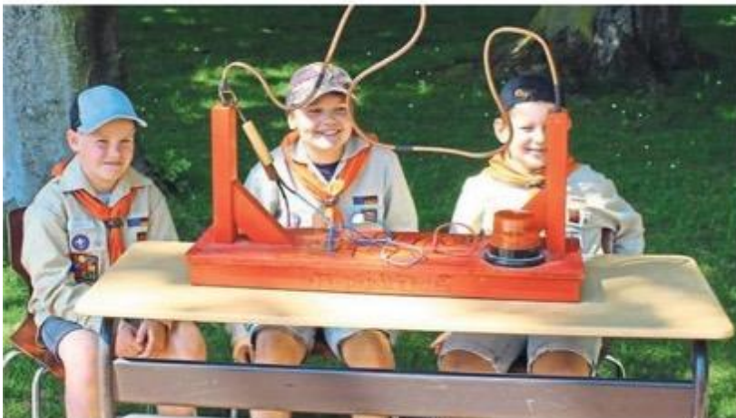
Vermutlich so alt wie die Salinenkirmes selbst: Der heiße Draht.

Besonders viele Besucher gingen auch wieder beim Trödel auf Schatz- und Schnäppchensuche. Andere Schätze gab es auch bei der Tombola zu gewinnen. Hauptpreis war ein Rundflug über den Ort. Auf die Gabel gab's selbstverständlich auch was: Neben Salattaschen, Waffeln und der klassischen Mantaplatte warteten besagte Aperolbar oder auch selbstgebackene Kuchen in der Cafeteria auf Genießer.