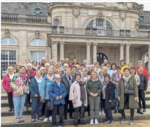
50 Frauen der kfd Bad Westernkotten besuchten das GOP Variété in Bad Oeynhausen.