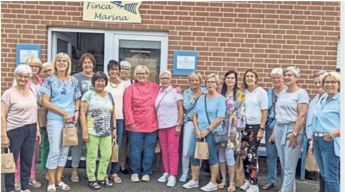
Die Frauen der kfd Bad Westernkotten Gruppe Vier Jahreszeiten verbrachten einen schmackhaften Nachmittag in der Gewürzmanufaktur Finca Marina in Westenholz.