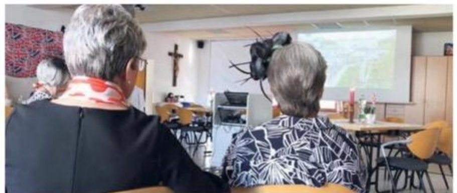
Im Mittelpunkt stand die Liveübertragung des royalen Spektakels in der ARD.

Die Frauen der kfd ließen sich davon nicht das Event vermiesen. „Die Geselligkeit zählt“, waren sich am Ende alle einig.