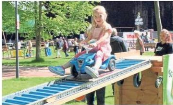
Auf der Rollbahn ging's rasant hinab.

Anschließend begann ein Tag voller Entertainment. Einige vergrabene Schätze warteten auf dem Trödelmarkt auf neue Besitzer – oder die Gäste konnten sich mit etwas Glück einen der Hauptgewinne bei der Tombola schnappen. In diesem Jahr gab es für die Hauptgewinner einen Rundflug mit dem Hubschrauber, ein Stand-Up-Paddle oder auch ein Zelt. Für alle anderen gab es eine große Auswahl an verschiedensten Trostpreisen, die von lokalen Gewerbetägern gespendet wurden. Mit dabei waren Gesellschaftsspiele,