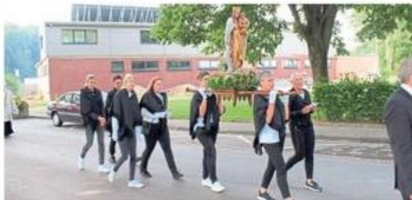
Die Marienstatue wurde zur Prozession durch das Dorf getragen.