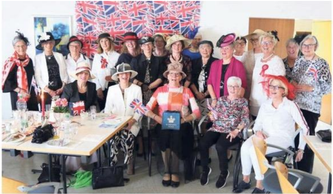
Mit viel Liebe zum Detail und stilechten Hüten beging die kfd Bad Westernkotten das Event.