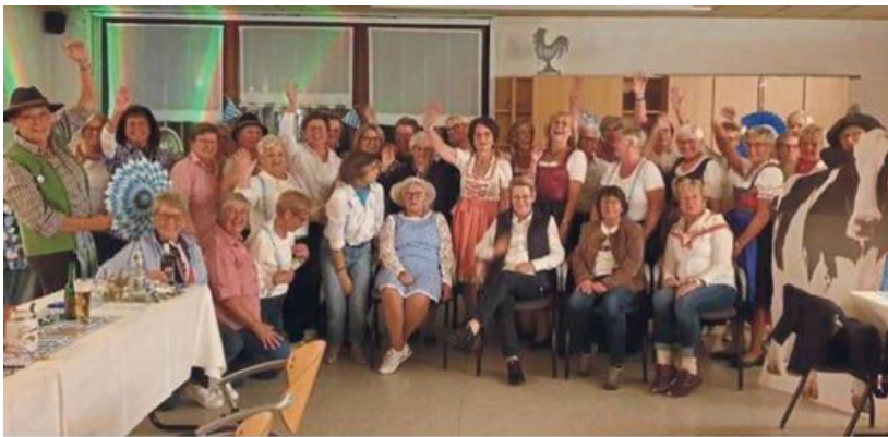
Die Gruppe Vier Jahreszeiten der kfd Bad Westernkotten feierte ein zünftiges Oktoberfest mit Blasmusik und Weißwurst.