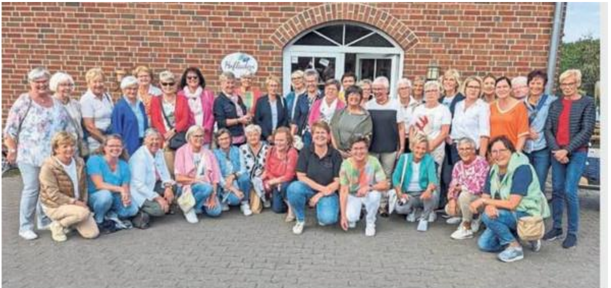
Die Frauen der Gruppe „Vier Jahreszeiten“ der kfd Bad Westernkotten verbrachten vergnügliche Stunden auf dem Pflaumenhof Stemich im Pflaumendorf Stromberg.