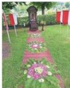
Die einzelnen Stationen des Lobetagsfeiers werden immer feierlich geschmückt.

Und so läuft der Lobetagsfeier in diesem Jahr ab: Bereits am Freitag, 30. Juni, um 15 Uhr beginnen die Feierlichkeiten