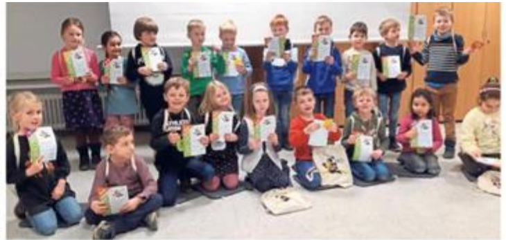
Stolz zeigen die Vorschulkinder des St. Elisabethkindergartens ihre Urkunden.

Eine Elterninitiative des St. Elisabeth-Kindergartens hat die Teilnahme organisiert, aber auch die Vorschulkinder der Kita Abenteuerland und der Kita Regenbogen haben in diesem Schuljahr das Angebot bereits wahrgenommen.