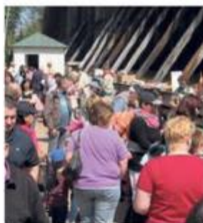
Der Flohmarkt ist immer ein Renner.

Zusätzlich gibt es auf der Kirmes zahlreiche Spielstände, die von den Pfadfinder-