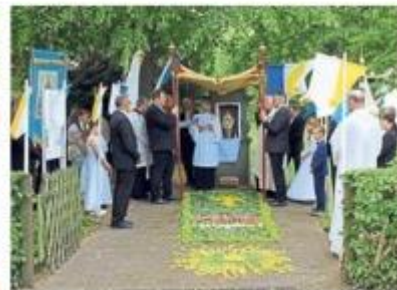
Bunt und feierlich dekoriert zeigte sich die Antoniuslinde.