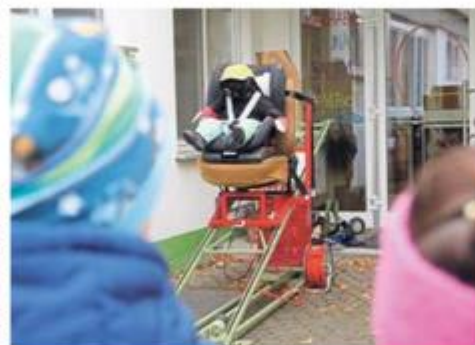
Noch sitzt Dummy Franz-Xaver sicher im Sitz. In der zweiten Runde erfährt er, was das Fehlen eines Gurtes bedeutet.