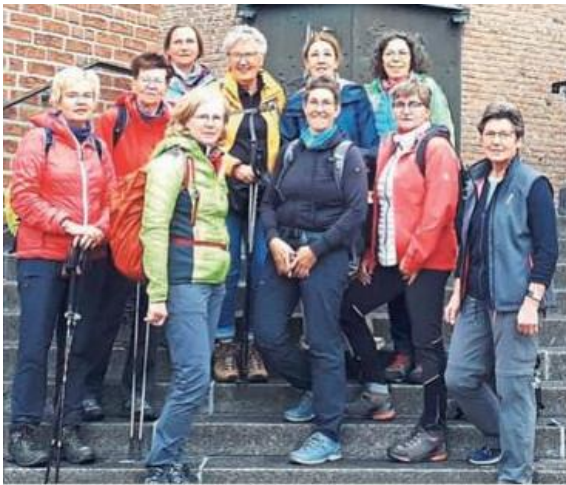
Im diesem Jahr ging die Wanderung der kfd Bad Westernkotten von der Abtei Königsmünster zum Bergkloster Bestwig.

Teenierödelmarkt im Johanneshaus direkt an der Kirche. Von 11 bis 14 Uhr bleibt von Bekleidung über Spielzeug bis hin zu Kinderwagen und Fahrrädern kein Wunsch offen. Für Verpflegung ist mit Hot Dogs und Waffeln sowie kalten und warmen Getränken gesorgt. Der Erlös der Cafeteria kommt einem sozialen Zweck zugute. [Patriot, 25.10.2023]