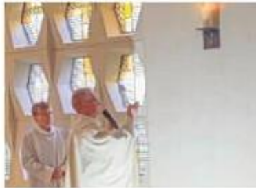
Der 13. Leuchter.

Bad Westernkotten – Im Zuge der Kirchenrenovierung – und durch Anregung eines Artikels in der Verbandszeitung „Junia“ – wurde in Bad Westernkotten ein 13. Apostelleuchter angeschafft. Das teilt die kfd mit. Er stehe stellvertretend für all die Frauen, die in der Nachfolge Jesu aktiv waren und sind. Die Apostelin