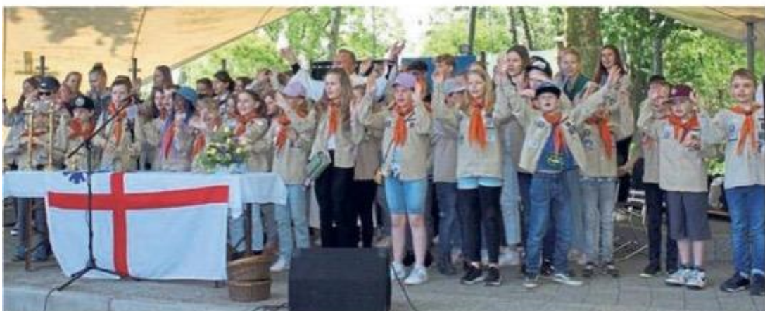
Auch den Gottesdienst zum Salinenkirmes-Auftakt gestalteten die Pfadfinder mit.