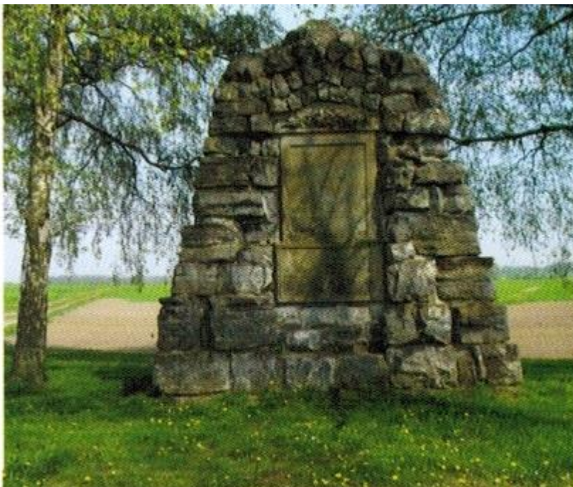
Denkmal zur Erinnerung an die Schlacht bei Vellinghausen

Als das erstmals 1303 urkundlich erwähnte Gut Schweckhausen erinnert nur eine Wappentafel. Das ebenso alte Haus Borghausen war vermutlich ein kölnisches Burgmannslehen zur Sicherung gegen die Grafen von der Mark im Westen. Aufschlussreich ist der Verkauf 1619 des Hauses an den bürgerlichen Goswin Klocke. Er war als Erbgesessener und Ratsherr zu Soest und Erbsälzer zu Sassendorf wohl finanziell gut aufgestellt. Sein Nachfahre ließ ein neues umgräftetes Herrenhaus und Wirtschaftsgebäude errichten, nachdem das ursprüngliche Haus im Dreißigjährigen Krieg zerstört worden war. Das Haus Nateln, ebenfalls im 14. Jahrhundert als Rittergut nachgewiesen, wurde im Siebenjährigen Krieg während der Schlacht von Vellinghausen (1761) zerstört. Die Gräfte des erhaltenen Gräften- Rings lässt darauf schließen, dass seine Ausmaße mit denen des benachbarten Haus Nehlen vergleichbar waren. Das noch vorhandene anderthalb-geschossige Herrenhaus aus Fachwerk wurde 1800 erbaut.