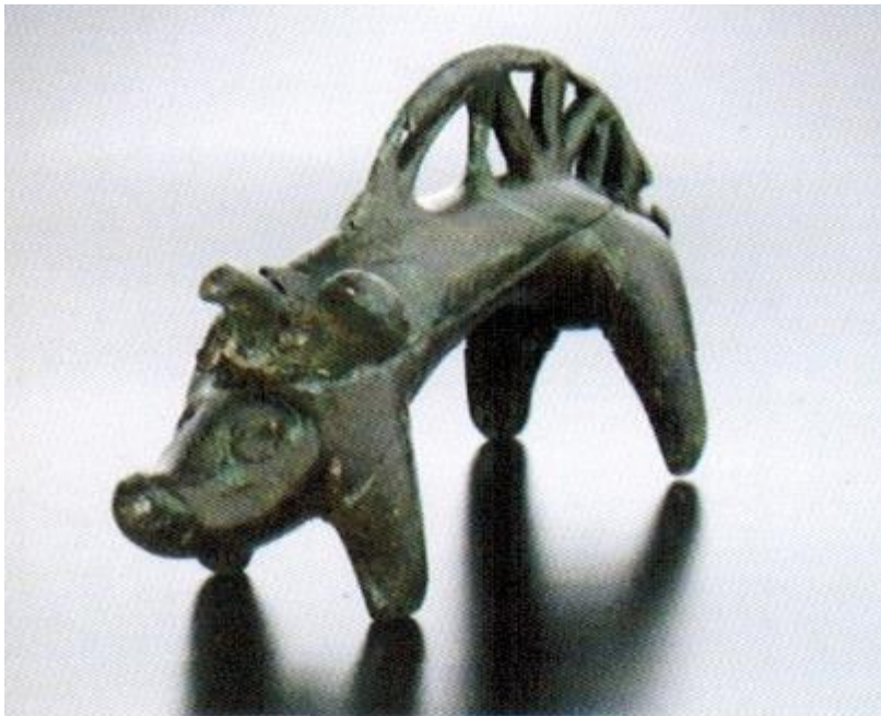
Keltische Eberstatuette

Auch andere Waren wurden gehandelt und ausgetauscht. Ein ‚exotisches‘ Beispiel ist eine keltische Eberstatuette, die vom süddeutsch-österreichischen Raum nach Erwitte gelangt ist.