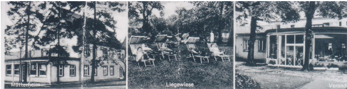
Solbad Westernkotten i. W.