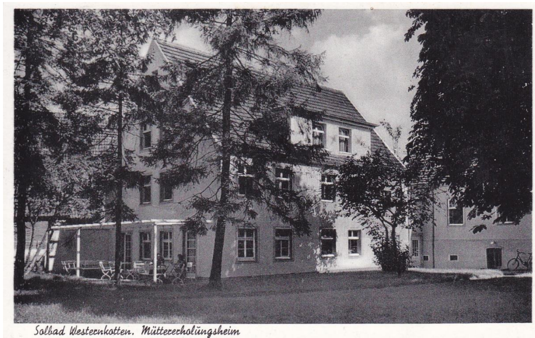
Solbad Westerkotten. Müttererholungsheim